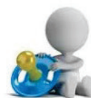
Asili nido/Centri estivi