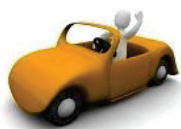
Mobilità e Assicurazioni